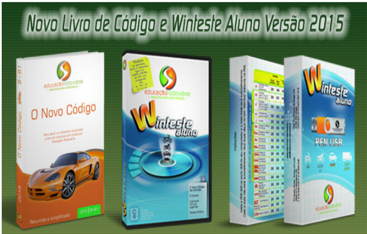
Novo Livro de Código e Winteste Aluno "CD e Pen USB" Versão 2015